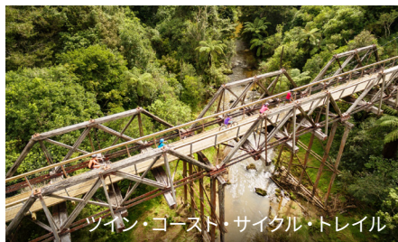
ツイン・コースト・サイクル・トレイル