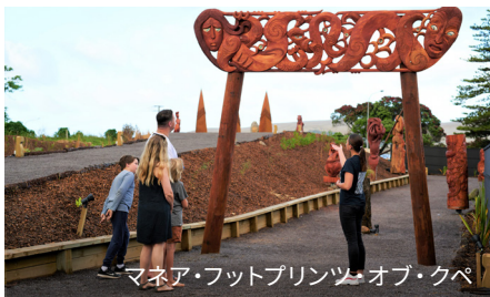
マネア・フットプリンツ・オブ・クペ

タスマン海と太平洋が交わるアオテアロア・ニュージーランドの北端は、マオリの人々にとって神聖な場所です。それは故人の魂はここから最後の旅に出ると信じられているからです。フラーズ・グレートサイツは、テ・オネロア・ア・トヘ、90マイル・ビーチのオフロード・ツアーを主催しています。ソルト・エアで上空から美しい風景を一望してもよいでしょう。