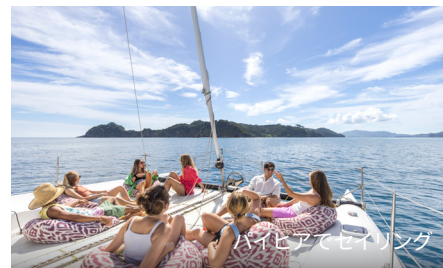
パイヒアでセイリング