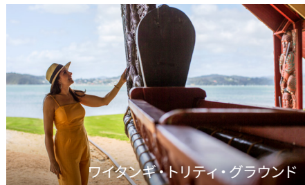
ワイタンギ・トリティ・グラウンド