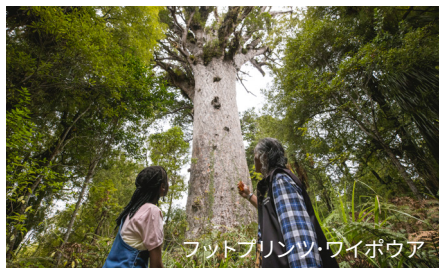
フットプリンツ・ワイボウア