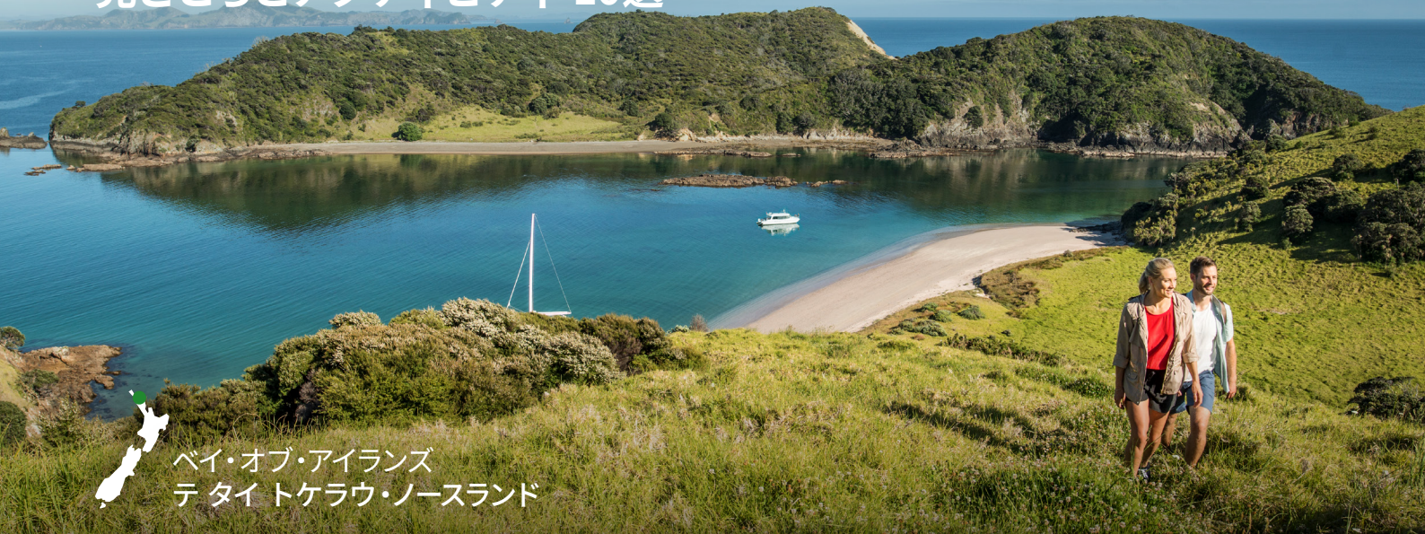
ベイ・オブ・アイランズ テタイトケラウ・ノースランド

亜熱帯のタイトケラウ・ノースランドは、一年を通して休暇にぴったりの場所です。オークランドから車で簡単に行くことができます。アオテアロア・ニュージーランド生誕の地として知られるこの地方は、文化的、歴史的な見どころが多く、古代樹カウリの森や水辺、人里離れた島々など、驚くほど美しい自然に恵まれています。