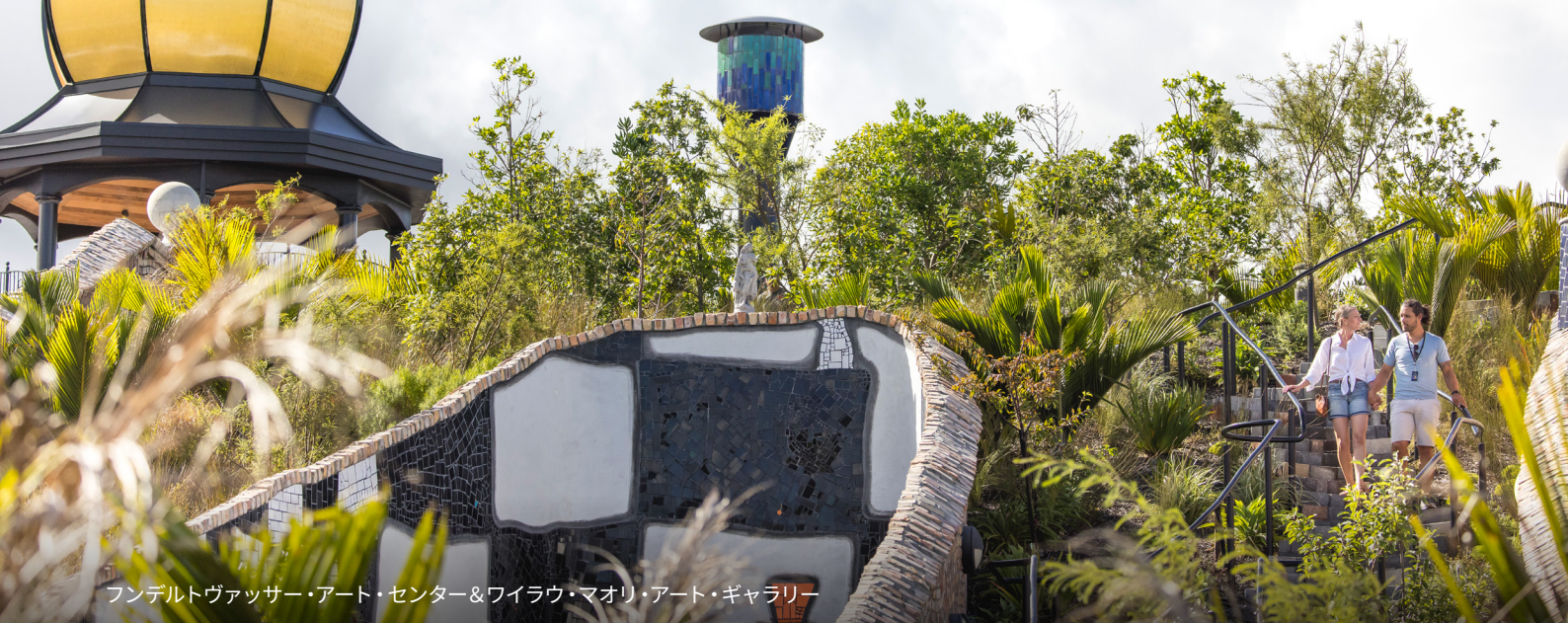
フンデルトヴァッサー・アート・センター&ワイラウ・マオリ・アート・ギャラリー