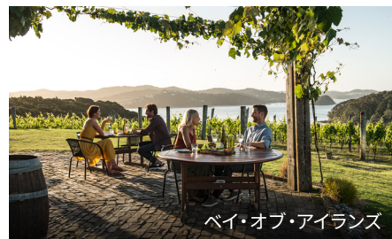
ベイ・オブ・アイランズ