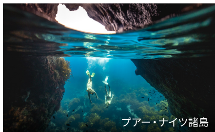
プアー・ナイツ諸島

グルメな旅のモデルコースを参考にして、タイトケラウ・ノースランドならではのおもてなしと、亜熱帯地方の食材を存分に味わってください。数あるワイナリーや農産物の直売所、ファーマーズ・マーケットで、新鮮なシーフード、地元産のワイン、とびきりのお料理が楽しめます。デューク・オブ・マールボロ・バー&レストランは見逃せません。パイヒアからフェリーですぐの対岸にある魅力的な町、ラッセルの老舗で、ニュージーランド最古の酒類販売許可証を有するホテルです。ビールやワインを片手にくつろぎましょう。