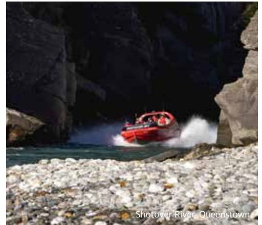
Shotover River, Queenstown