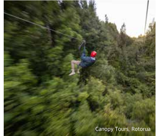
Canopy Tours, Rotorua