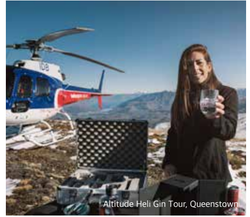
Altitude Heli Gin Tour, Queenstown

발목에 줄을 묶고 뛰어내리는 스릴 넘치는 모험을 경험하지 않았다면 뉴질랜드를 여행했다고 할 수 없습니다. 다리, 점프대, 절벽 끝에 설치된 플랫폼, 협곡 위, 심지어는 오클랜드에서 가장 높은 타워 위에서도 번지점프를 즐길 수 있습니다. 모험정신을 발휘해서 번지점프를 멋지게 성공해 보세요.