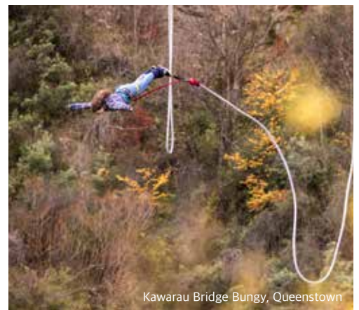
Kawarau Bridge Bungee, Queenstown