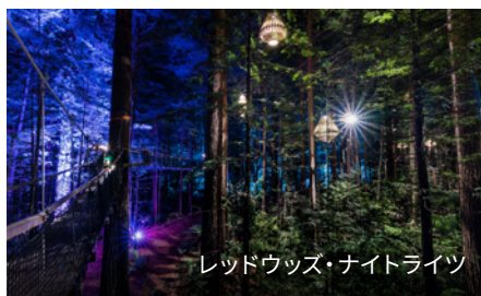
レッドウッズ・ナイトライツ

ロトルアは家族全員で楽しめるアドベンチャー・アクティビティがそろった、ニュージーランド・アオテアロアの遊園地です。スカイライン・ロトルアの Gondola で丘の上から湖と市街地の素晴らしい眺めを堪能した後は、名物のリュージュに乗ってダウンヒルのスピード感を満喫してください。ゾーブ・ロトルアでは、巨大なボールの中に入って坂を転がるというロトルア発祥のアクティビティが楽しめます。究極のアドレナリンを味わいたい方はヴェロシティ・バレーへ。アグロジェット・スピードボート、フリーフォール・エクストリーム、ロトルア・バンジー、シュウィープ、スウープなど、好きなだけ挑戦できます。