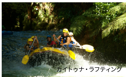
カイトゥナ・ラフティング