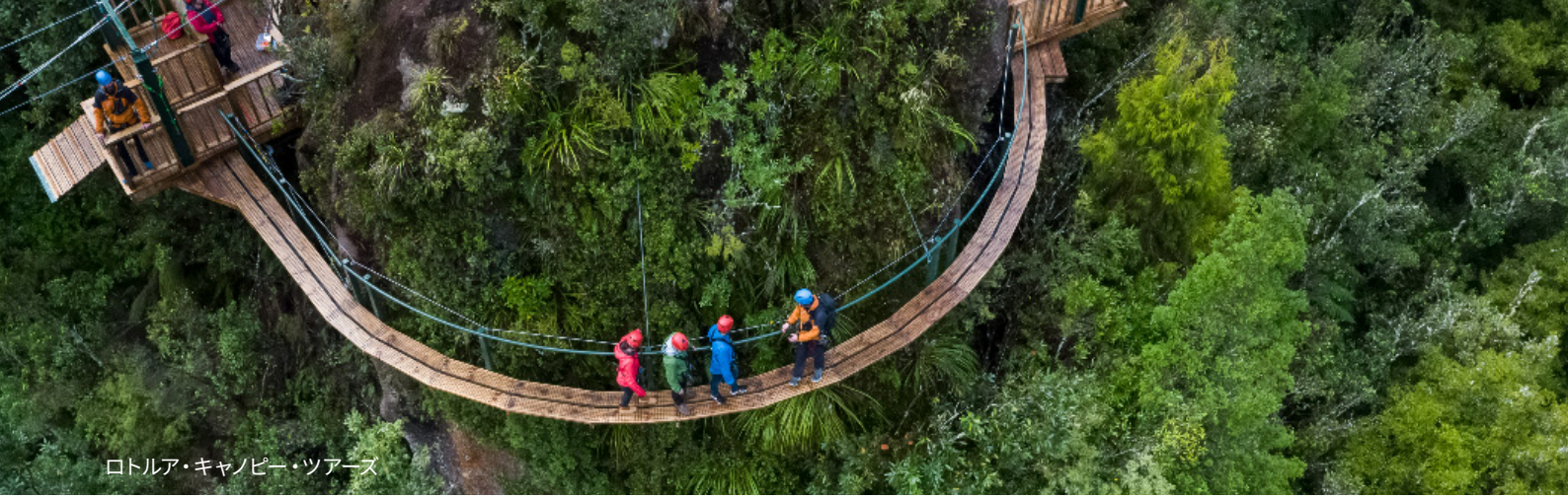
ロトルア・キャンピー・ツアーズ