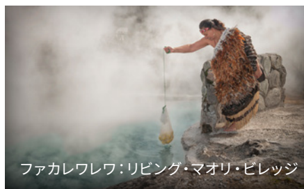
ファカレワレワ：リビング・マオリ・ビレッジ