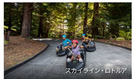
スカイライン・ロトルア