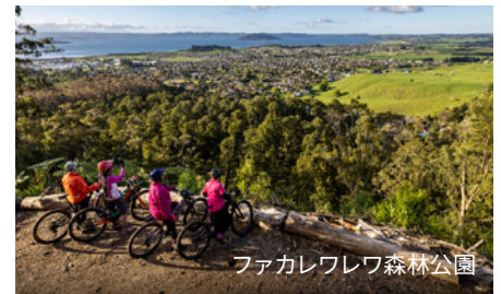
ファカレワレワ森林公園