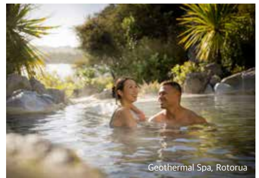
Geothermal Spa, Rotorua