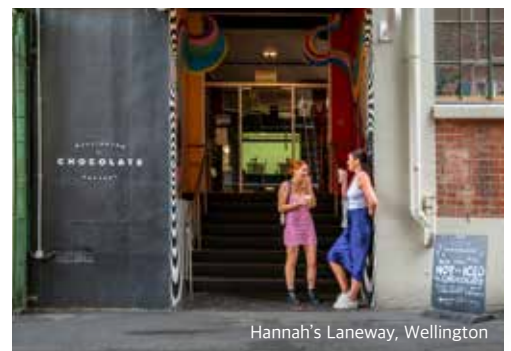
Hannah's Laneway, Wellington