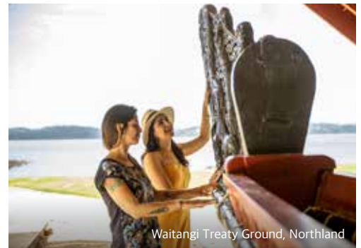
Waitangi Treaty Ground, Northland